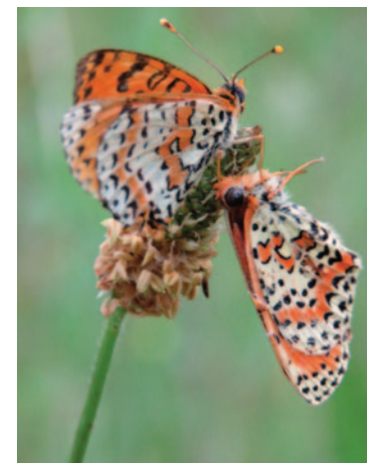
Direction de la Communication du Conseil départemental du Var - Pôle création graphique C. Jolly - 05 200