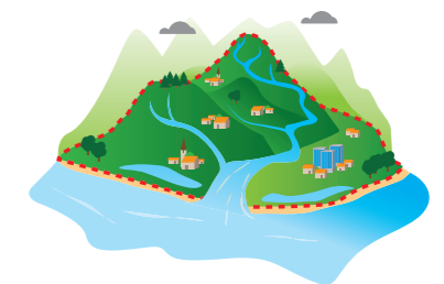
--- Limites du bassin versant

Un bassin versant est un territoire où toutes les précipitations qui s'écoulent se rejoignent en un même lieu, son exutoire. Pour déterminer les limites de ce bassin, il suffit de suivre les lignes de crête des reliefs qui l'entourent.