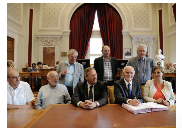
Signature de la convention-cadre le 19 juin 2013

Lancement de la première phase du programme d'actions de prévention des inondations (PAPI) sur l'Argens et ses affluents , portée par le Conseil Général du Var. Un projet labellisé au niveau national dont la mise en œuvre rassemble tous les acteurs locaux.